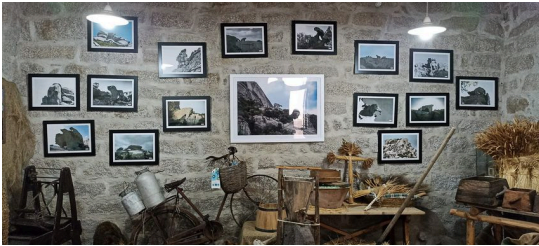
Dalla mostra "Il Cantico di Pietra": le splendide foto di Giuseppe Contini