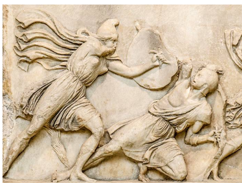
Battaglia fra le Amazzoni e i Greci - Fregio del mausoleo di Alicarnasso, 350 a.C. - British Museum